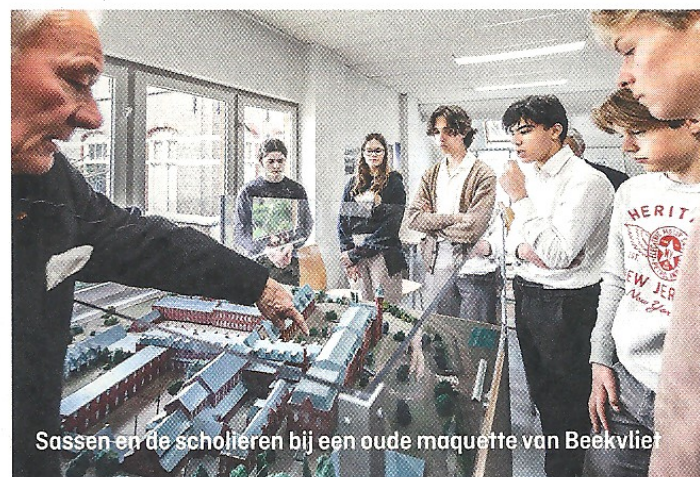
Sassen en de scholieren bij een oude maquette van Beekvliet

militaire plannen voor een invasie in Engeland bemachtigd en probeerde die het land uit te smokkelen. Bij een huiszoeking vonden de Duitsers Mekels valse persoonsbewijs en zijn wapen. De hele groep-Mekel werd in concentratiekamp Sachsenhausen vermoord.